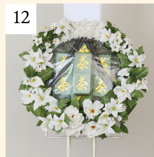
12 盛籠 お茶 1基 16,200円(税込)