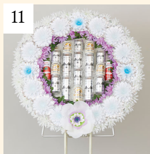
11 盛籠 ビール 1基 13,200円(税込)