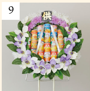
9 盛籠 缶詰 1基 10,800円(税込)