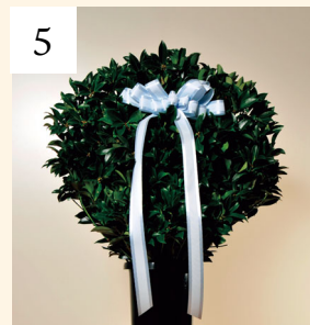
5 密 盛 1基 一般価格 13,200円(税込)