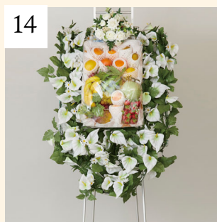
14 盛籠 果物 1基 16,200円(税込)