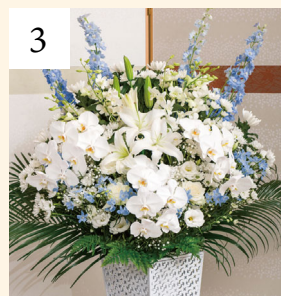
3 スタンドアレンジC 1基 一般価格 33,000円(税込)