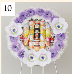
10 盛籠 缶詰(大) 1基 16,200円(税込)