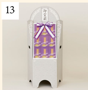
13 線香盛 1基 11,000円(税込)