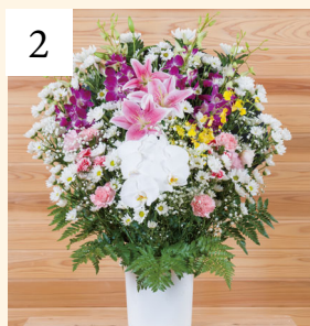
2 スタンドアレンジB 1基 一般価格 22,000円(税込)