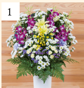
1 スタンドアレンジA 1基 一般価格 16,500円(税込)